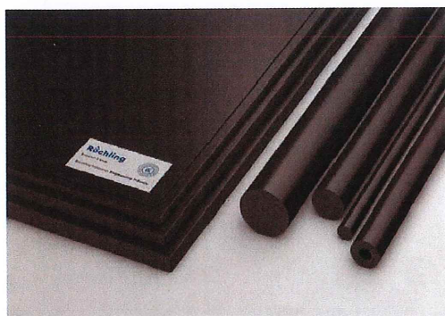
SUSTARIN C ブラック